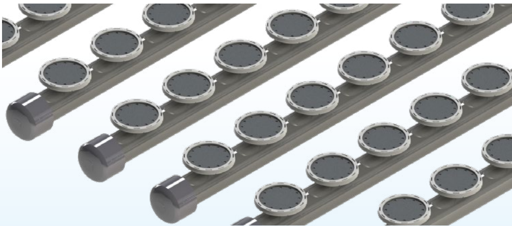
AIR DIFFUSER MBW

E' disponibile su richiesta diffusore MBW con valvola di non ritorno integrata - MBW diffuser with integrated check valve is available on demand